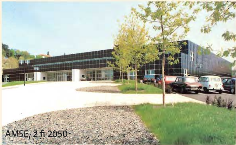
AMSE, 2 fi 2050

Un gros volume, des pièces encore à identifier, des sites multiples : l'archivage du musée d'art moderne constitue un des gros chantiers de l'année 2011.